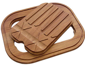
Tabla de corte Twin de madera Iroko