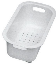
escurre pasta blanco

* sólo en combinación con el accesorio 8100 112