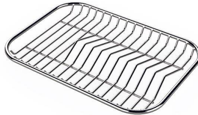
Rejilla portaplatos inox sólo se puede utilizar en combinación con los accesorios 8644 003