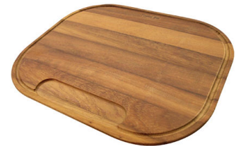
Tabla de corte de madera Iroko

* sólo en combinación con el accesorio 8644 003